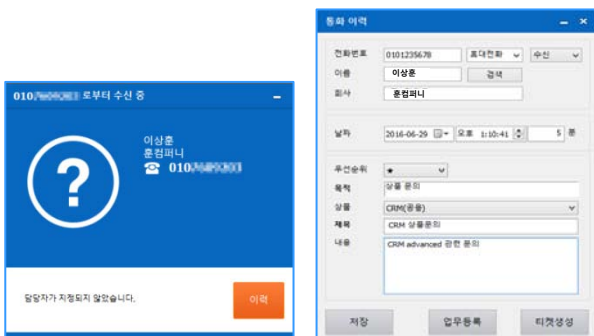
[PC 전화 수· 발신 / 고객별 통화이력 저장, 확인]